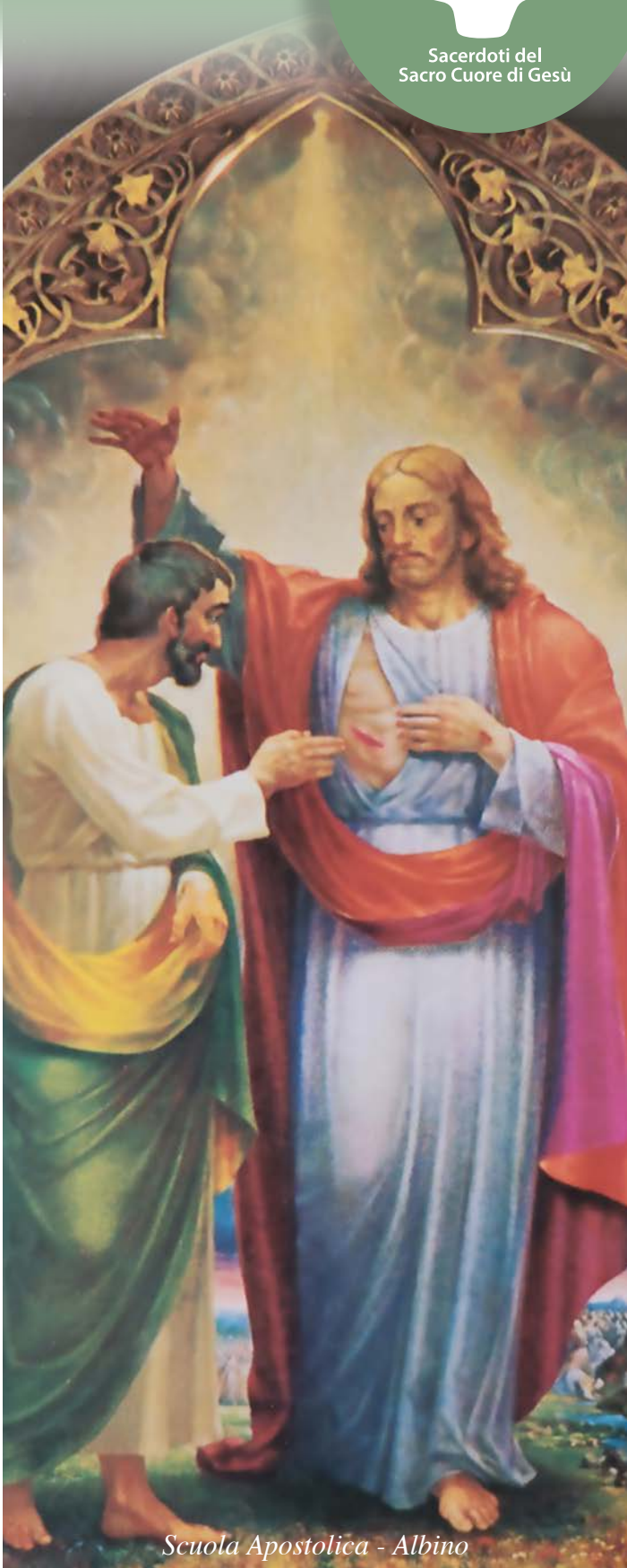
Scuola Apostolica - Albino

Gesù ci dà l'esempio più perfetto della vita d'amore, d'immolazione, di abbandono, di conformità alla volontà divina ... L'Ecce venio ("Ecco io vengo") è stato la sua regola di vita»