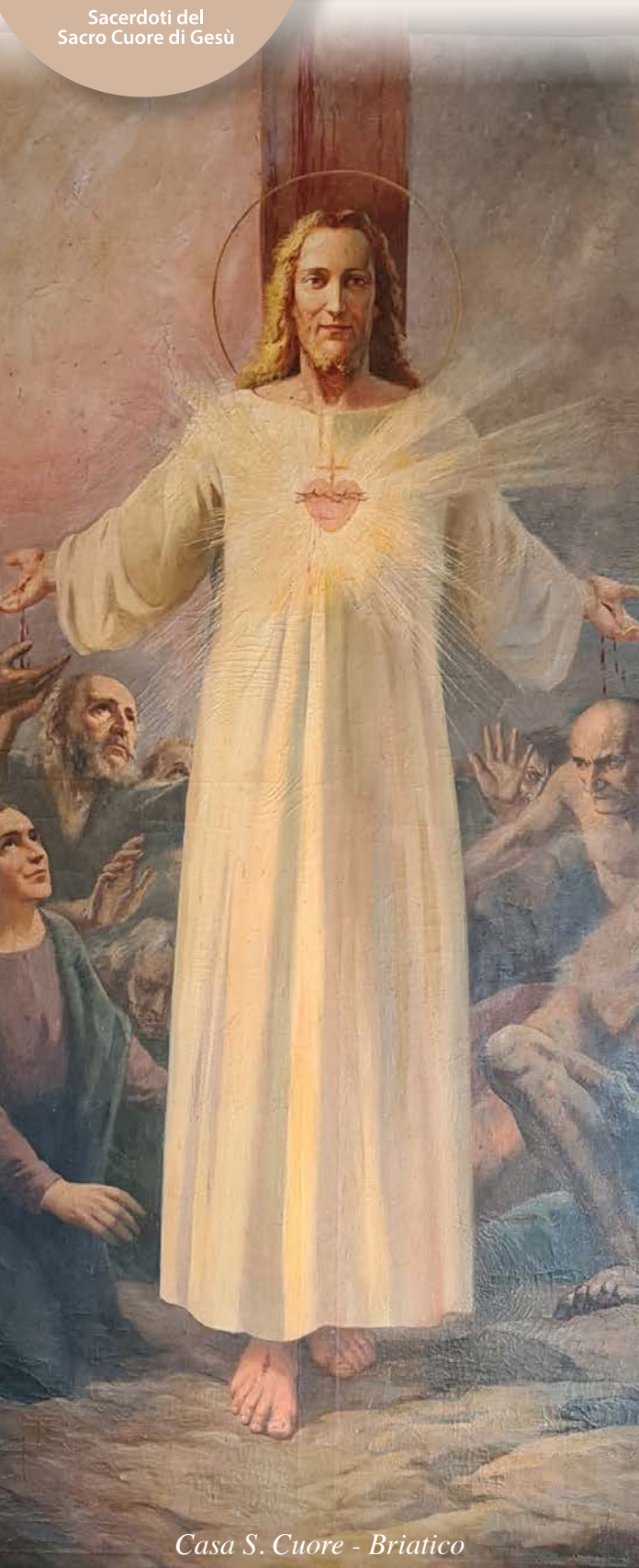
Casa S. Cuore - Briatico