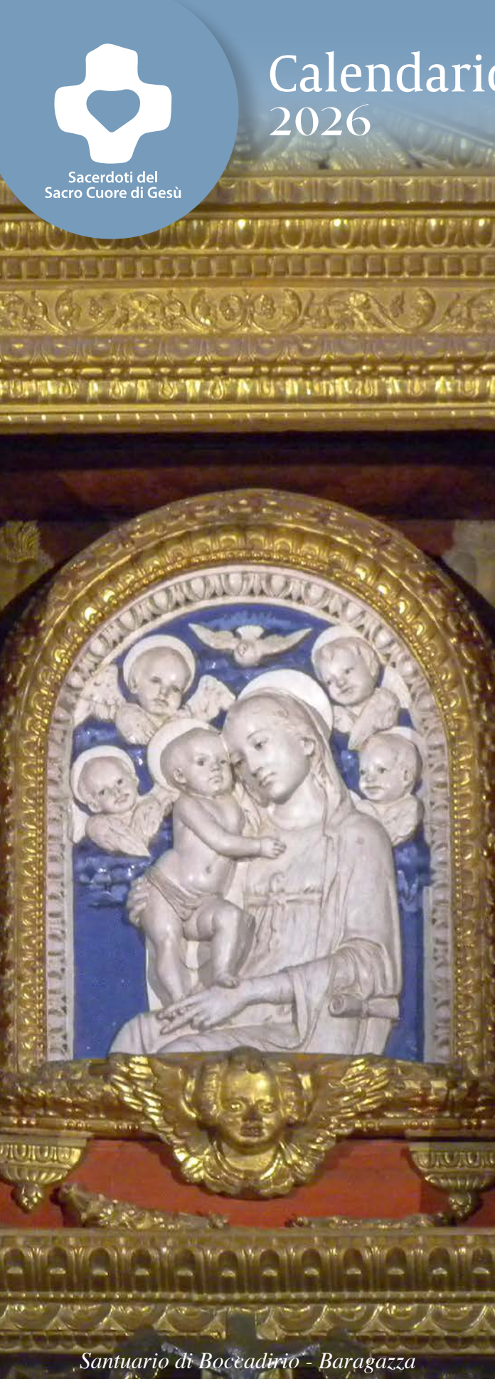
Santuario di Bocèadirio - Baragazza