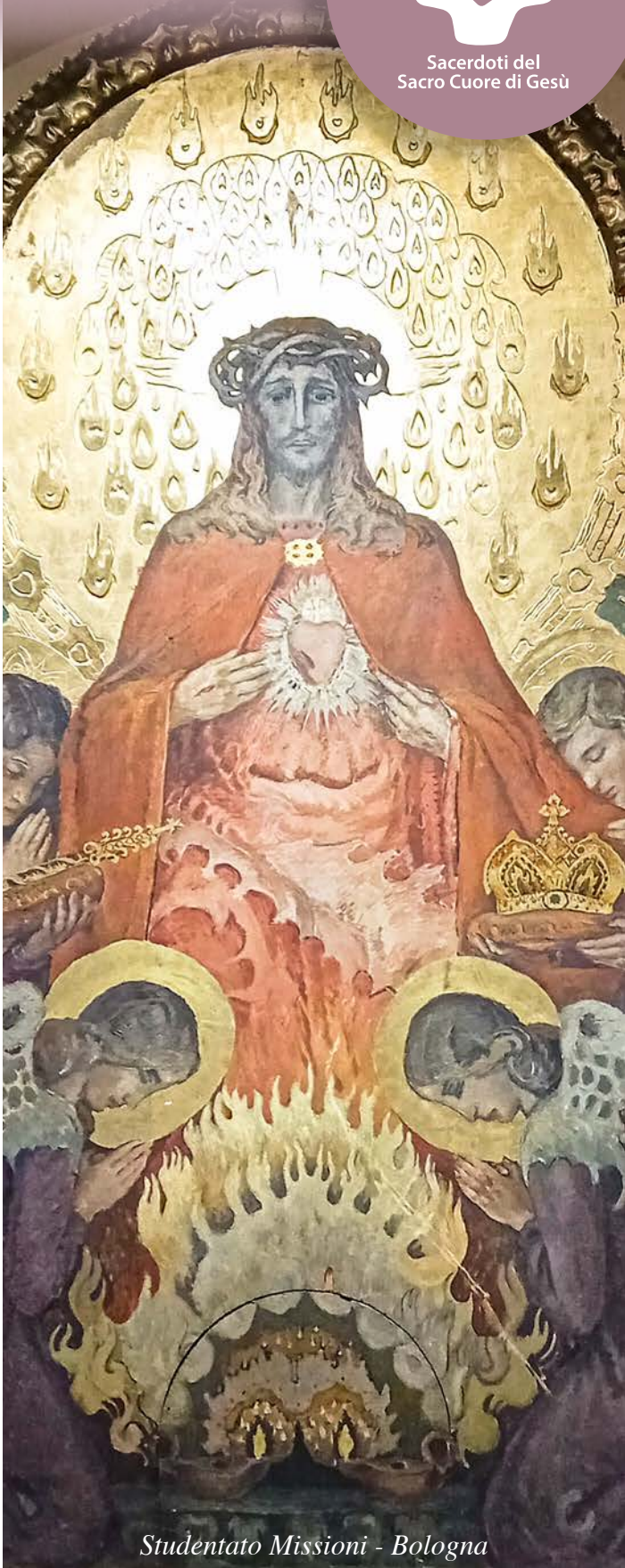
Studentato Missioni - Bologna