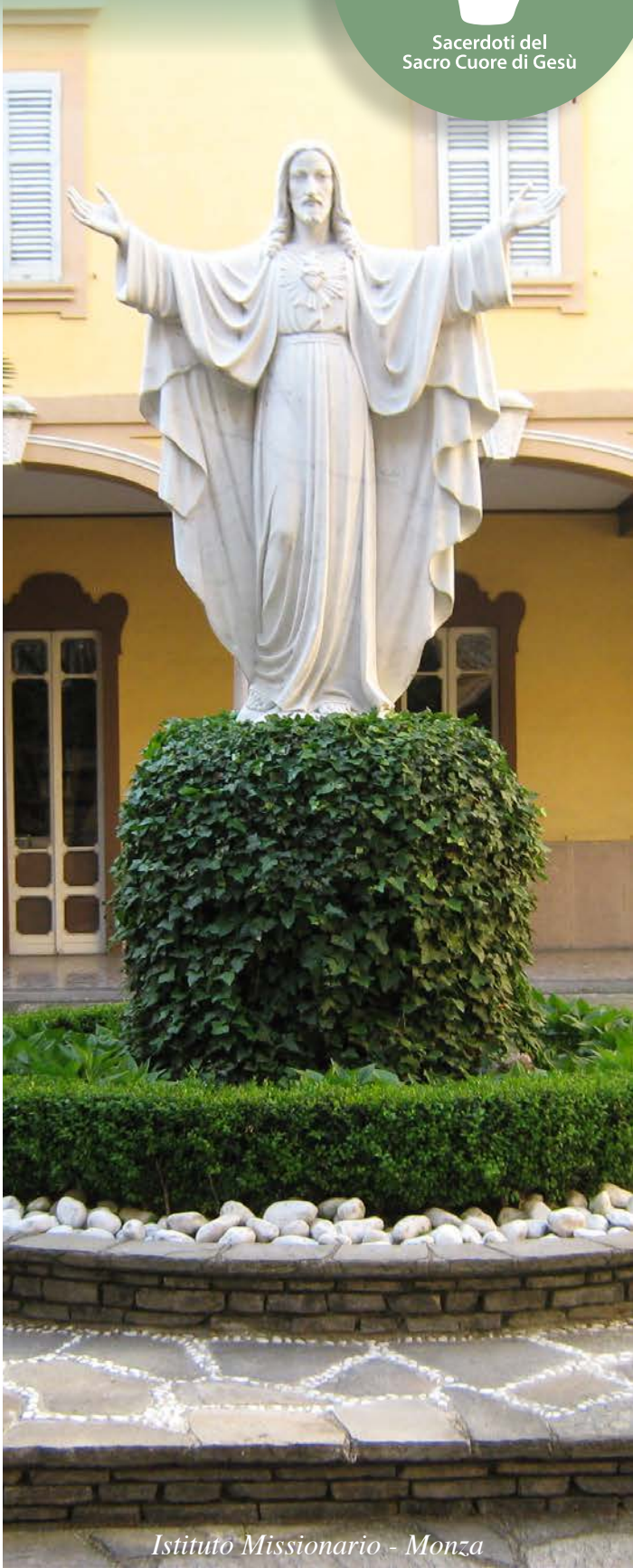
Istituto Missionario - Monza