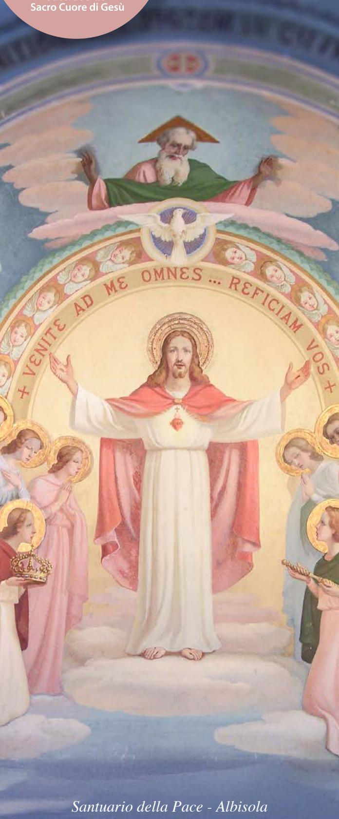
Santuario della Pace - Albisola